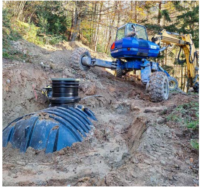
Im Herbst ist die eingefallene Steinmauer um die Grütthütte erneuert worden. Für die Wasserversorgung wurde ein Reservoir vergraben.

Der Grütclub hat die Hütte Ende März abgegeben. Woraufhin die Ortsgemeinde die Hütte neu einrichtete.