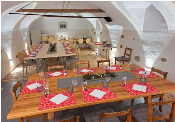
Der Verwaltungsrat und die Mitarbeiter der Ortsgemeinde Schänis konnten sich am Jahresschlusessen über den gelungenen Raum bei einem feinen Essen freuen.

Proben in Anspruch zu nehmen. Ein schöner Ort ist es auch für Anlässe wie Geburtstagsfeiern usw. Zur Reservierung sind die Benützungsmodalitäten sowie ein Link auf der Homepage aufgeschaltet.